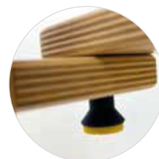
Veilige verstelbare moer.