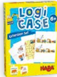
Bouwplaats +6 j