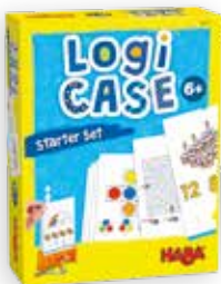
Raadselspel +6 j