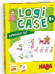
Prinsessen +5 j