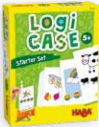
Raadselspel +5 j