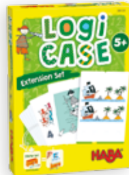
Piraten +5 j