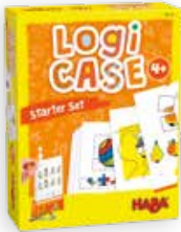
Raadselspel +4 j

Logi Case is een reeks van educatieve, individuele spellen waarbij het kind zichzelf kan controleren. 3 startsets met kleurrijke puzzels die met logisch nadenken op te lossen zijn. Een eenvoudig systeem maakt het mogelijk dat de kinderen zelf kunnen controleren of hun antwoord juist is.