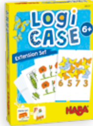
Natuur +6 j Dieren +4 j