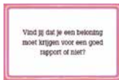
Uiten van je eigen mening.