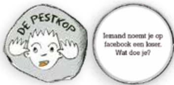
De pestkopkaartjes oefenen het probleem gerelateerd inzetten van pro-sociale vaardigheden.

Beleefdheid, assertiviteit, algemene kennis, sociale redzaamheid, sociale media, computergames, omgaan met (kinderen met) een beperking, andere godsdiensten, nieuw samengestelde gezinnen. (Cyber)pesten kreeg een prominente plaats in dit spel.