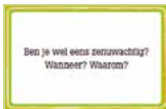
Praten over jezelf- persoonlijke vragen.