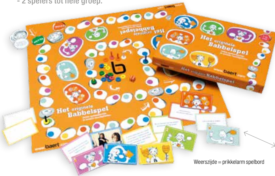
Weerszijde = prikkelarm spelbord