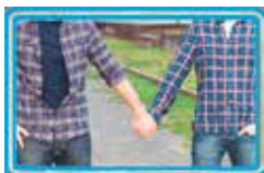
Spontaan praten aan de hand van een foto.