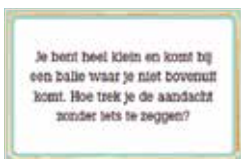
Non-verbale communicatie: doe-opdrachten.