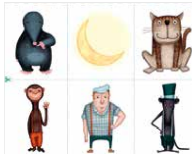
Ontmoet alle personages uit de leesboekjes