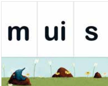
Verken de opbouw van een woord