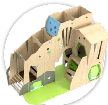
Speelwereld konijnenhol, links art.nr. 459023, op aanvraag.

Elke toren en grot kan worden uitgerust met een ligkussen. Valbeveiliging is vereist voor deze speelwereld. Afzonderlijk bestellen.