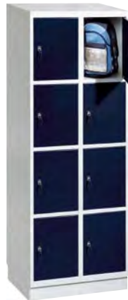
2 x 4 Vakken

Kleur voorzijde vermelden! Kleur corpus vermelden! Soort slot vermelden!