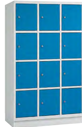
3 x 4 Vakken