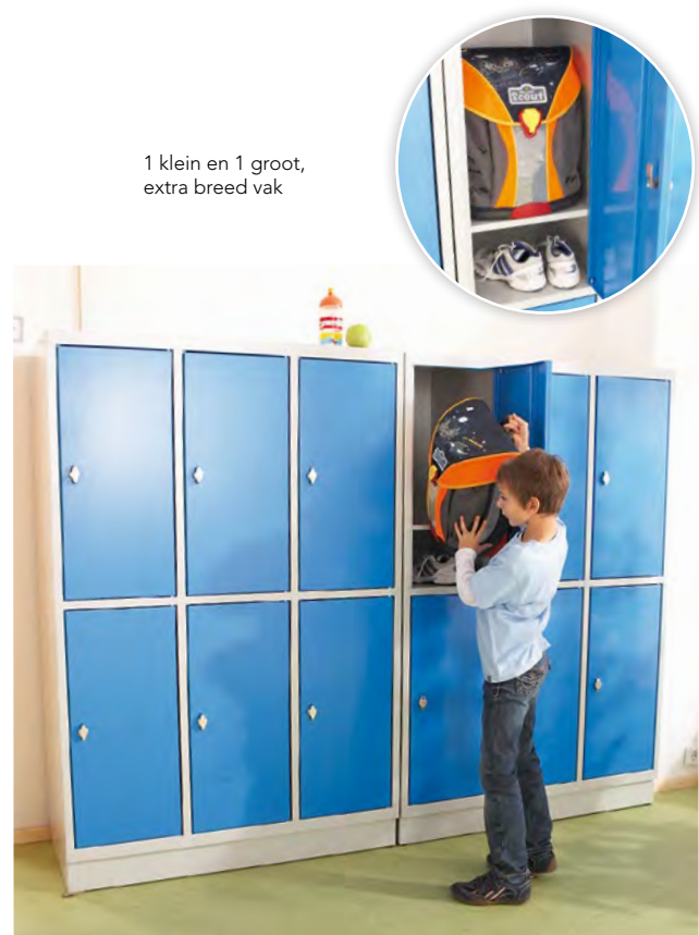
1 klein en 1 groot, extra breed vak

Kleur voorzijde vermelden! Kleur corpus vermelden! Soort slot vermelden!