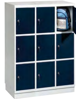
3 x 3 Vakken