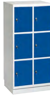
2 x 3 Vakken

Kleur voorzijde vermelden! Kleur corpus vermelden! Soort slot vermelden!