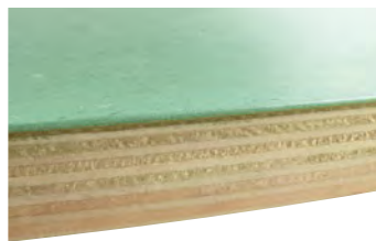
Podiumbodem: 25 mm dik, met linoleum bekleed → absoluut belastbaar en hygiënisch