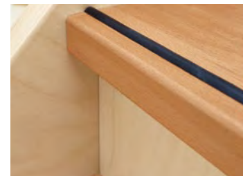
Traptreden: massief, slijtvast hardhout met antisliprand → stabiel en veilig