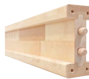
Draagbalk voor zware lasten: met dubbel T-profiel → extreme draagkracht en stabiliteit