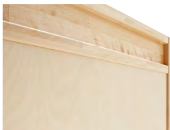
Panelen: berkenhout, gesleufd, zonder schroeven en overstek