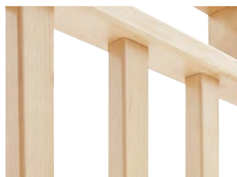
Spijlen: vierhoekig en afgerond → in tegenstelling tot ronde sporten, buigvrij